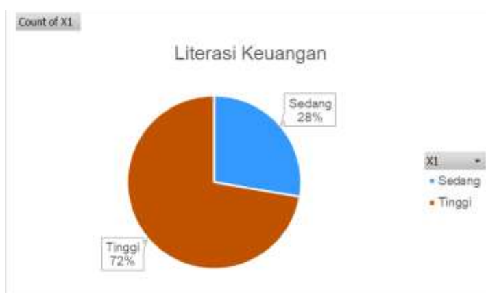
Gambar 1. Literasi Keuangan UMKM di Sampit

Berdasarkan data yang dikumpulkan, maka dapat digambarkan tingkat literasi keuangan pelaku UMKM di Kota Sampit. Literasi keuangan yang diukur melalui 8 pernyataan dengan jawaban benar atau salah yang kemudian dapat dikategorikan ke dalam 3 kategori yaitu tinggi (70%-100%), sedang (40%-69%), dan rendah (0-39%). Berikut adalah tingkat literasi keuangan UMKM di Sampit.