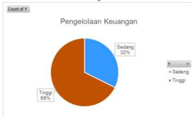
Gambar 4. Pengelolaan UMKM

kemampuan pelaku usaha dalam mencatat transaksi, mengendalikan pengeluaran, serta menentukan prioritas keuangan usaha agar penggunaan teknologi keuangan benar-benar mendukung kualitas pengelolaan keuangan UMKM.