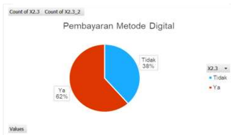
Gambar 3. Pembayaran Metode Digital