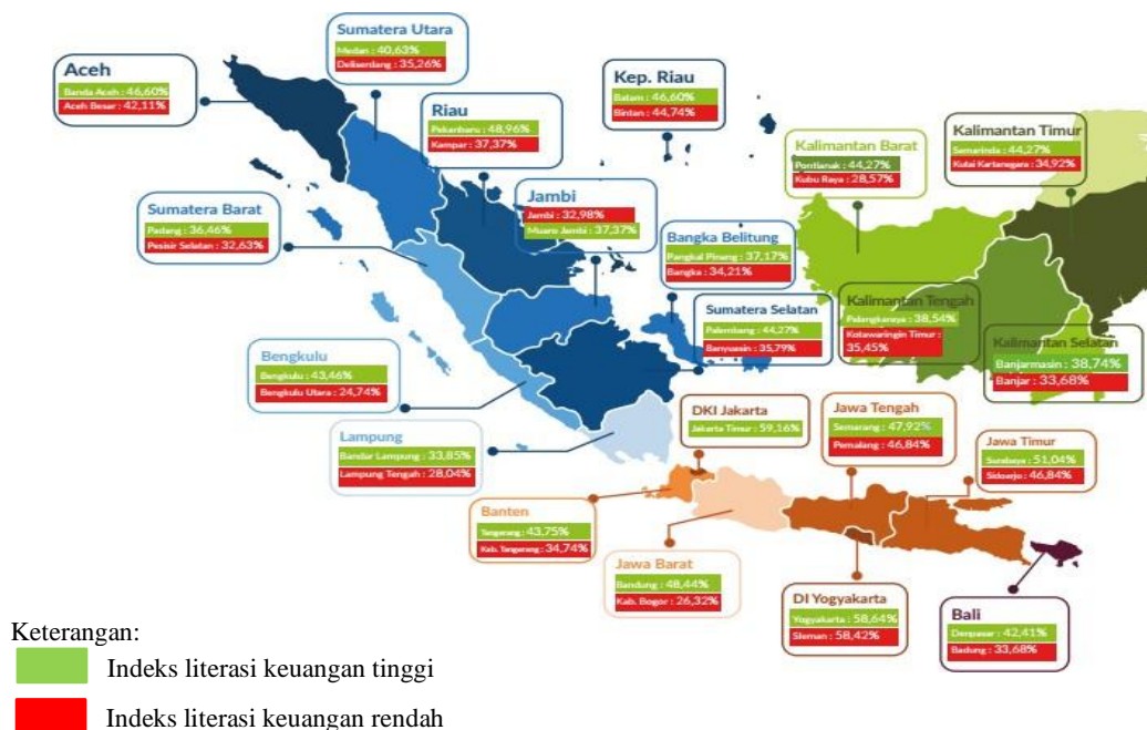
Gambar 1. Indeks Literasi Keuangan Tahun 2019 per Provinsi Berdasarkan Strata Wilayah

Gaya hidup konsumtif yang lebih mengutamakan citra sosial sering kali menyebabkan pengeluaran yang tidak terkendali. Jika tidak diimbangi dengan kesadaran dan disiplin finansial yang baik, hal ini dapat berdampak negatif pada generasi muda dalam mengelola keuangannya (Anjani & Wirawati, 2018). Akibatnya, mereka berisiko mengalami utang berlebih, kesulitan mencapai tujuan keuangan jangka panjang, atau bahkan menghadapi masalah finansial yang lebih serius. Selain itu, banyak tenaga kerja muda memilih merantau atau tinggal jauh dari orang tua, dengan salah satu pertimbangan utamanya adalah faktor ekonomi. Keinginan untuk mencari penghidupan yang lebih baik sering kali mendorong mereka berpindah ke daerah dengan kondisi ekonomi yang lebih menjanjikan. Faktor ini menjadi pendorong utama bagi tenaga kerja muda dalam upaya meningkatkan kesejahteraan finansial mereka (Tamrin, 2017).